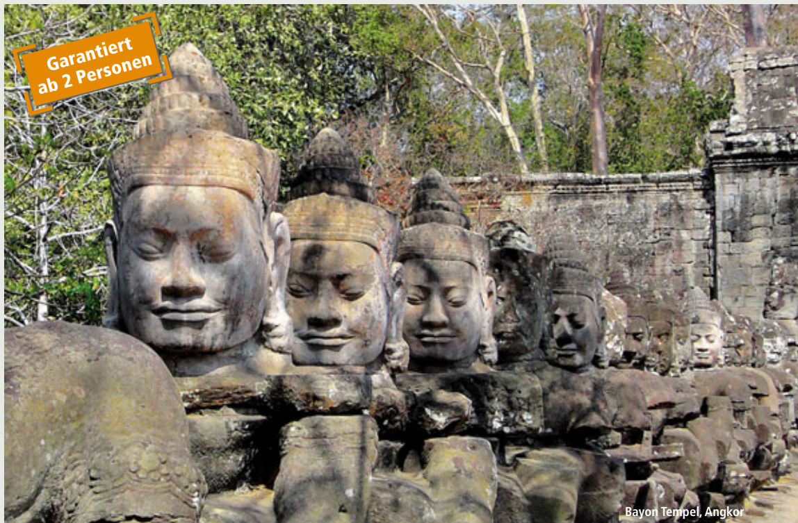
Bayon Tempel, Angkor

Kambodscha, Vietnam und Laos – die auch als Kulturzentrum Asiens bekannte Region öffnet sich erst allmählich dem Tourismus und hält somit noch viele verborgene Schätze zum Entdecken für Sie bereit. Sie beginnen in Kambodscha, wo ein Besuch des architektonischen Wunderwerks Angkor Wat nicht fehlen darf. Weiter geht es in die quirlige Metropole Ho Chi Minh Stadt, dem einstigen Saigon, im Süden Vietnams. Von dort führt die Reise durch Vietnam in Richtung Hanoi, landschaftliche Highlights warten mit der Fahrt über den Wolkenpass und dem Duftfluss in Hue auf Sie. Zum Abschluss geht es in das noch wenig von modernen Einflüssen berührte Laos, wo der unverfälschte buddhistische Glaube allgegenwärtig erscheint.