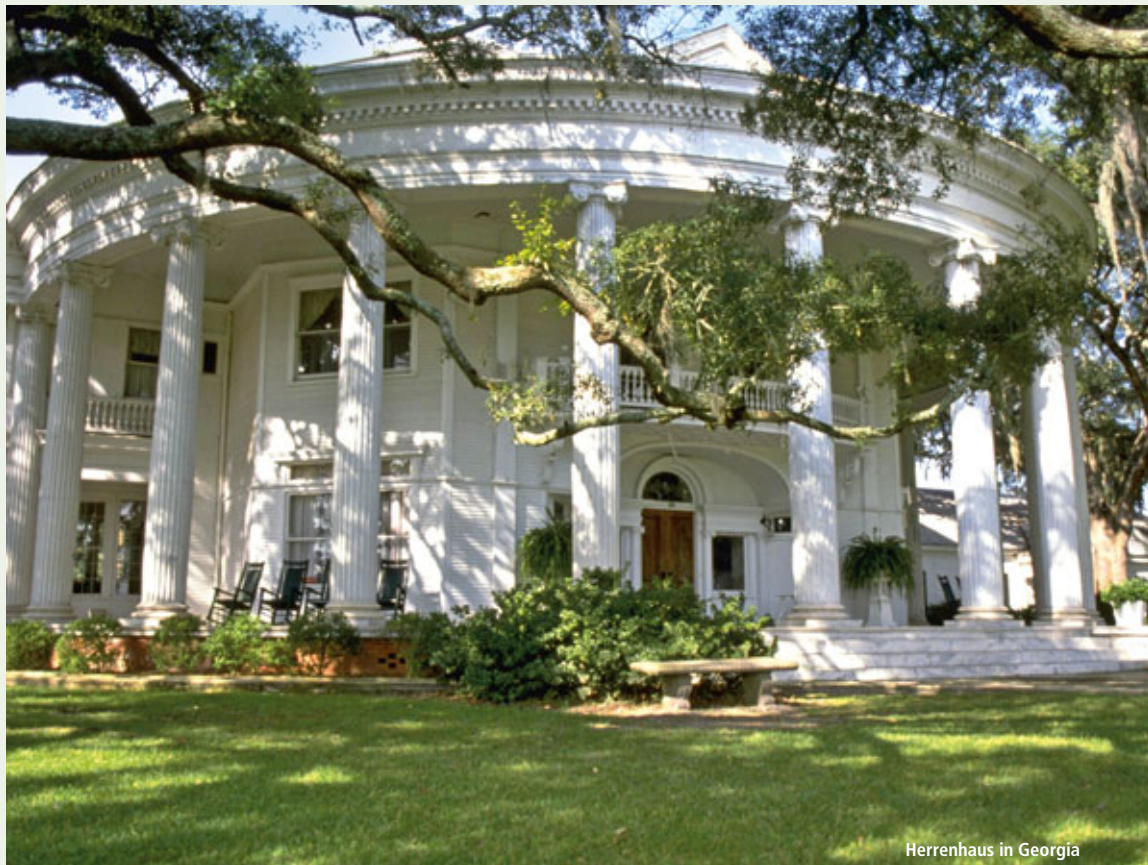
Herrenhaus in Georgia

Sie starten in Orlando im Sonnenstaat Florida und erkunden von dort aus die schönsten Orte des amerikanischen Südens, wie Memphis und New Orleans. Dabei dürfen natürlich Country, Blues & Rock'n'Roll nicht fehlen. Besonderes Highlight ist die Übernachtung auf einer romantischen Plantage.