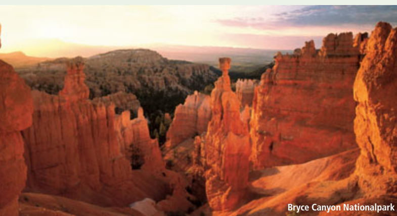
Bryce Canyon Nationalpark