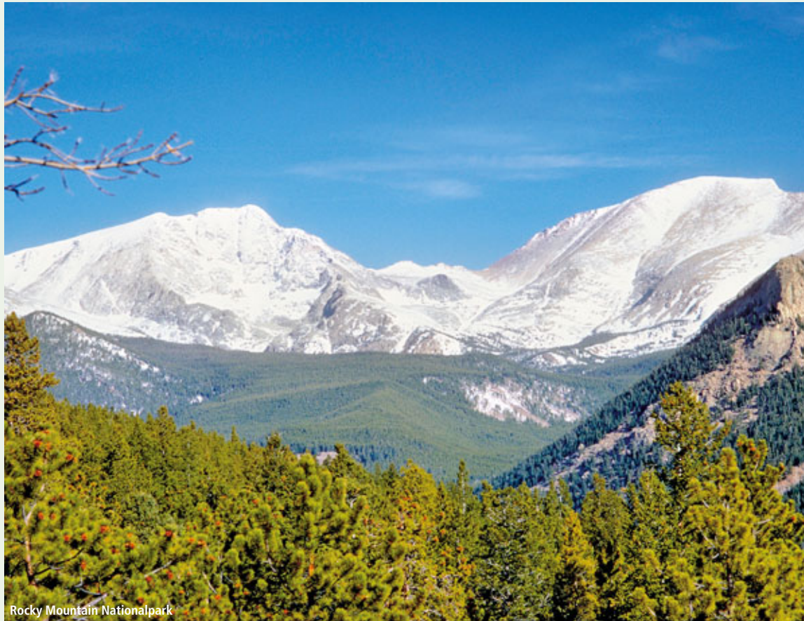
Rocky Mountain Nationalpark

Holiday Inn Golden Gateway ♦♦♦ (siehe Seite 412) Anf H Leistung SFO88124 AN Unterbr RI