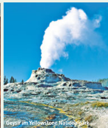
Geysir im Yellowstone Nationalpark