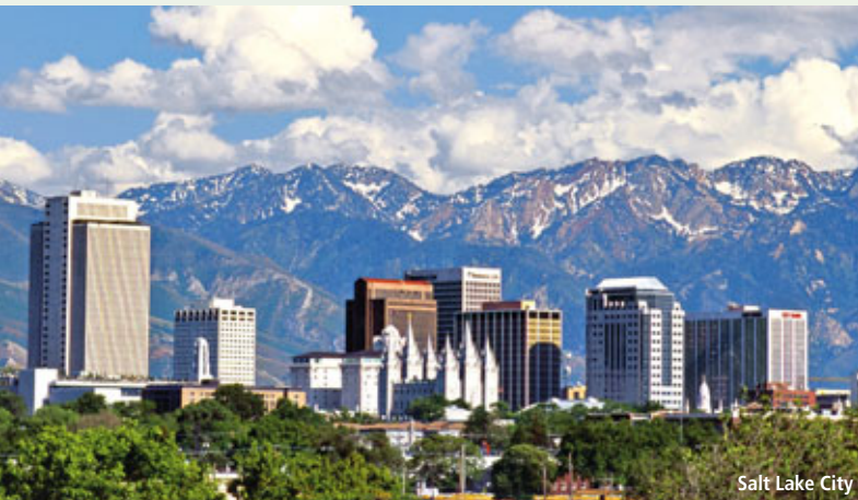
Salt Lake City