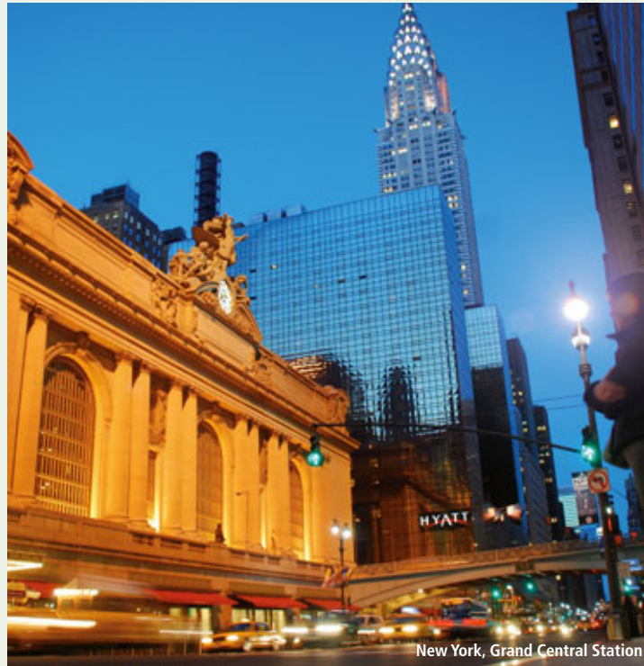
New York, Grand Central Station

Hotel New Casablanca on the Ocean ♦♦♦ (siehe Seite 298) Anf H Leistung MIA31085 AN Unterbr BI