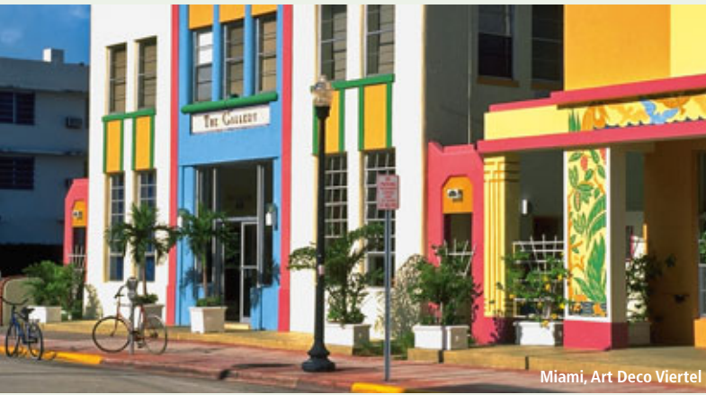
Miami, Art Deco Viertel