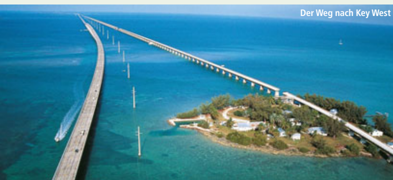
Der Weg nach Key West