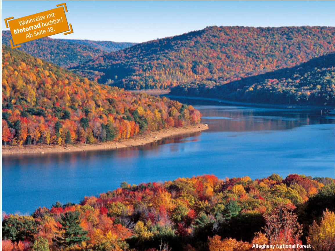
Allegheny National Forest

H. I. Midtown 57th Street ♦♦♦ (siehe Seite 256) Anf H Leistung NYC88004 AN Unterbr RI