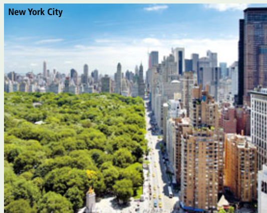
New York City