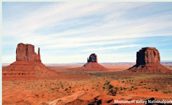
Monument Valley Nationalpark