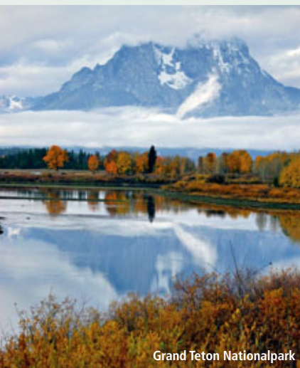
Grand Teton Nationalpark