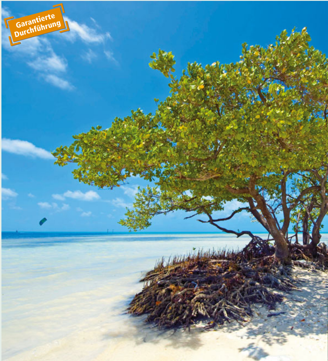
Strand auf den Florida Keys

Entdecken Sie die vielen attraktiven Seiten Floridas: Miami Beach, das Raumfahrtzentrum in Cape Canaveral, die Vergnügungsparks in Orlando, die Golfküste und Key West. Zusätzlich Sonne tanken können Sie bei der 15-tägigen Variante.