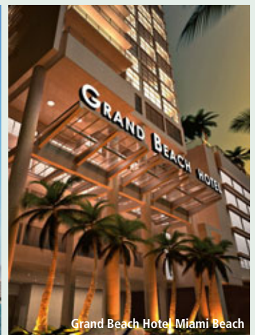
Grand Beach Hotel Miami Beach