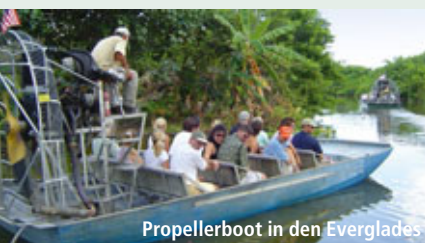
Propellerboot in den Everglades