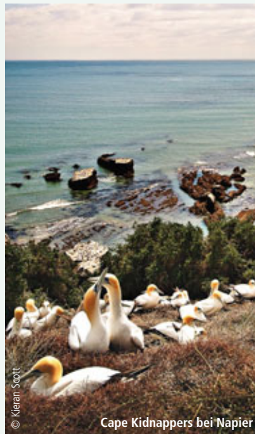
Cape Kidnappers bei Napier