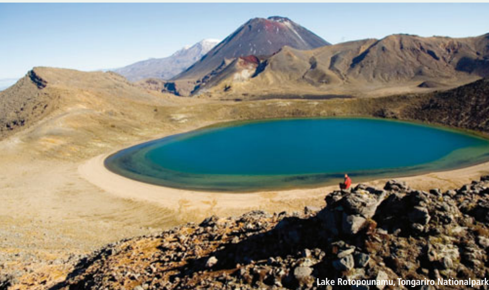
Lake Rotopounamu, Tongariro Nationalpark