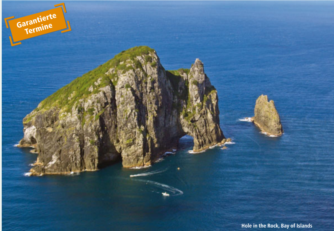
Hole in the Rock, Bay of Islands

Kristallklare Gebirgsbäche, Schlamm-tümpel und Geysire, eine Bootstour durch Fjordlandschaften, Wanderwege auf einsamen Inseln und selten besuchte Naturregionen wie Stewart Island. Dies und mehr erwartet Sie auf dieser Reise, während der Sie die Unberührtheit Neuseelands in einer kleinen Gruppe mit persönlicher Betreuung durch einen erfahrenen Reiseleiter kennenlernen.