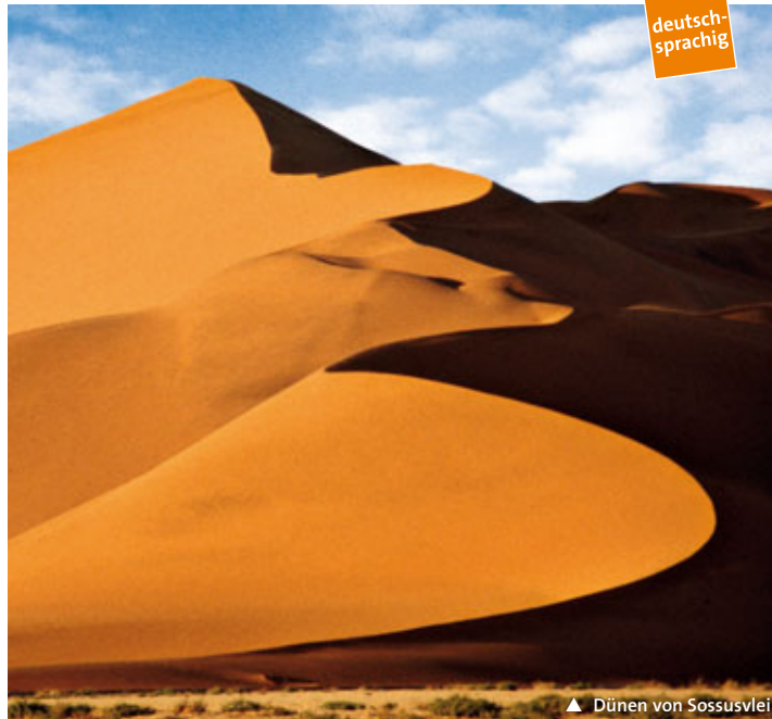
▲ Dünen von Sossusvlei

13 Tage/10 Nächte ab/bis Deutschland, 11 Tage/10 Nächte ab/bis Windhoek