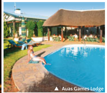
▲ Awas Games Lodge