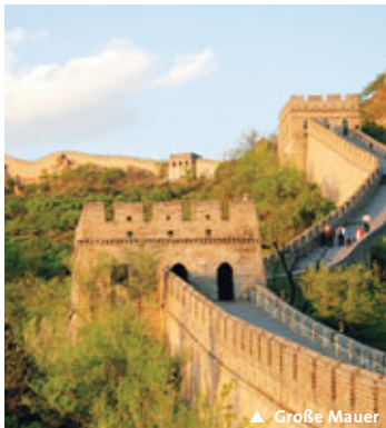
▲ Große Mauer