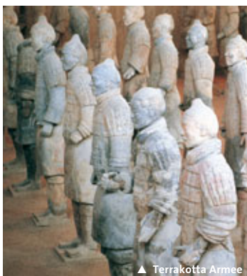
▲ Terrakotta Armee