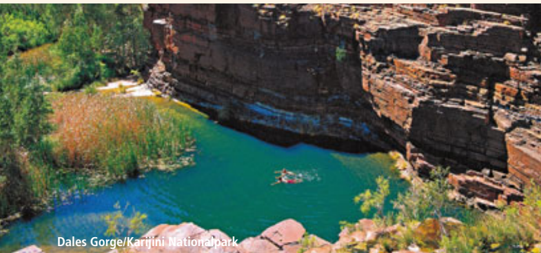
Dales Gorge/Karijini Nationalpark