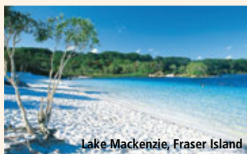
Lake Mackenzie, Fraser Island