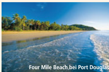
Four Mile Beach bei Port Douglas